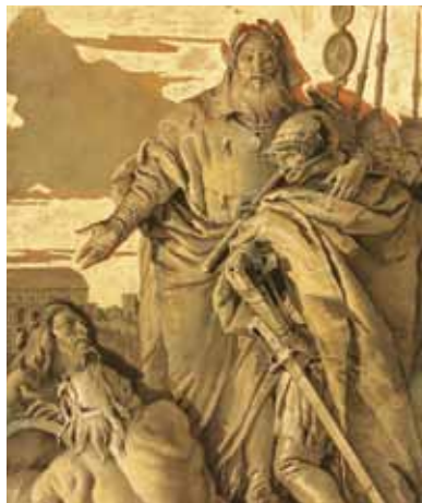
Giandomenico Tiepolo Jacopo Porto wird 1022 zum Gouverneur von Vicenza ernannt um 1757 (Detail)