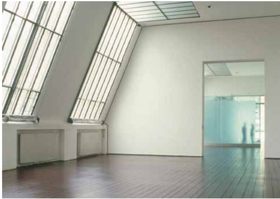
Einblick in den Ausstellungsraum des Augarten Contemporary

Ortes zu aktivieren, wird sich Thyssen-Bornemisza Augarten Contemporary vor allem monografischen Ausstellungen widmen. Die auf Recherche und Wissensproduktion basierenden Präsentationen entfalten dabei die weitreichenden Bestände der international anerkannten Sammlung der Stiftung. Künstler werden eingeladen, ihre eigenen Archive von Arbeiten, Dokumenten und Materialien zu erforschen und Präsentationsformen zu entwickeln, die Zwischenräume und Neuformulierungen entstehen lassen und resonanzartige