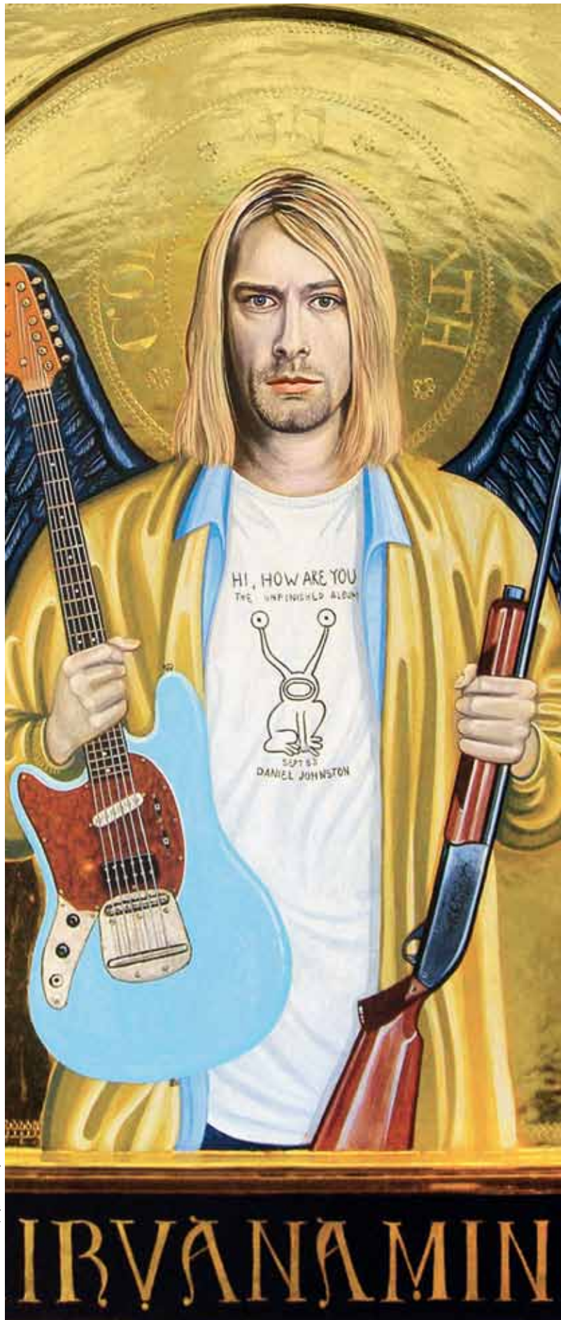
Peter Murphy Kurt Cobain Nirvanamind 2009 (Detail)