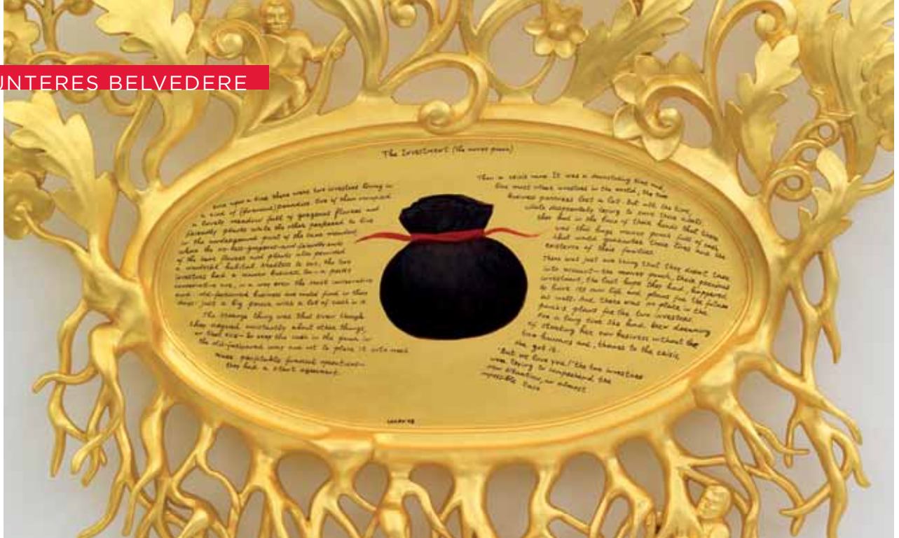
Nedko Solakov The Investment (the money pouch) 2008 (Detail)