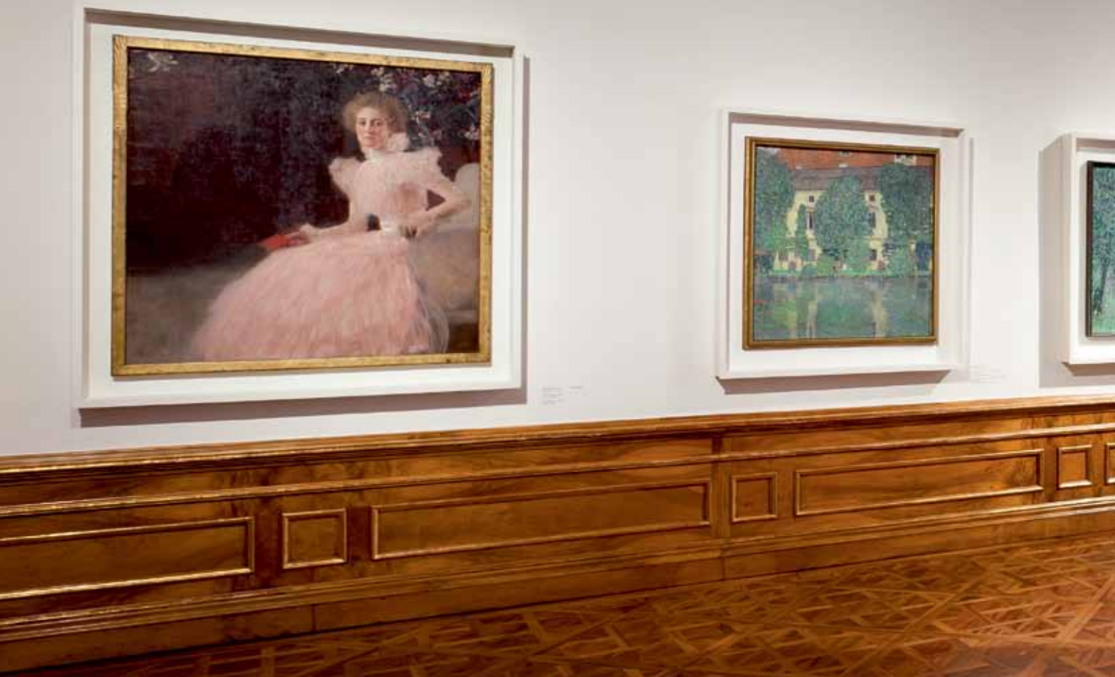
Einblick in den neu gestalteten Klimt-Raum im Oberen Belvedere