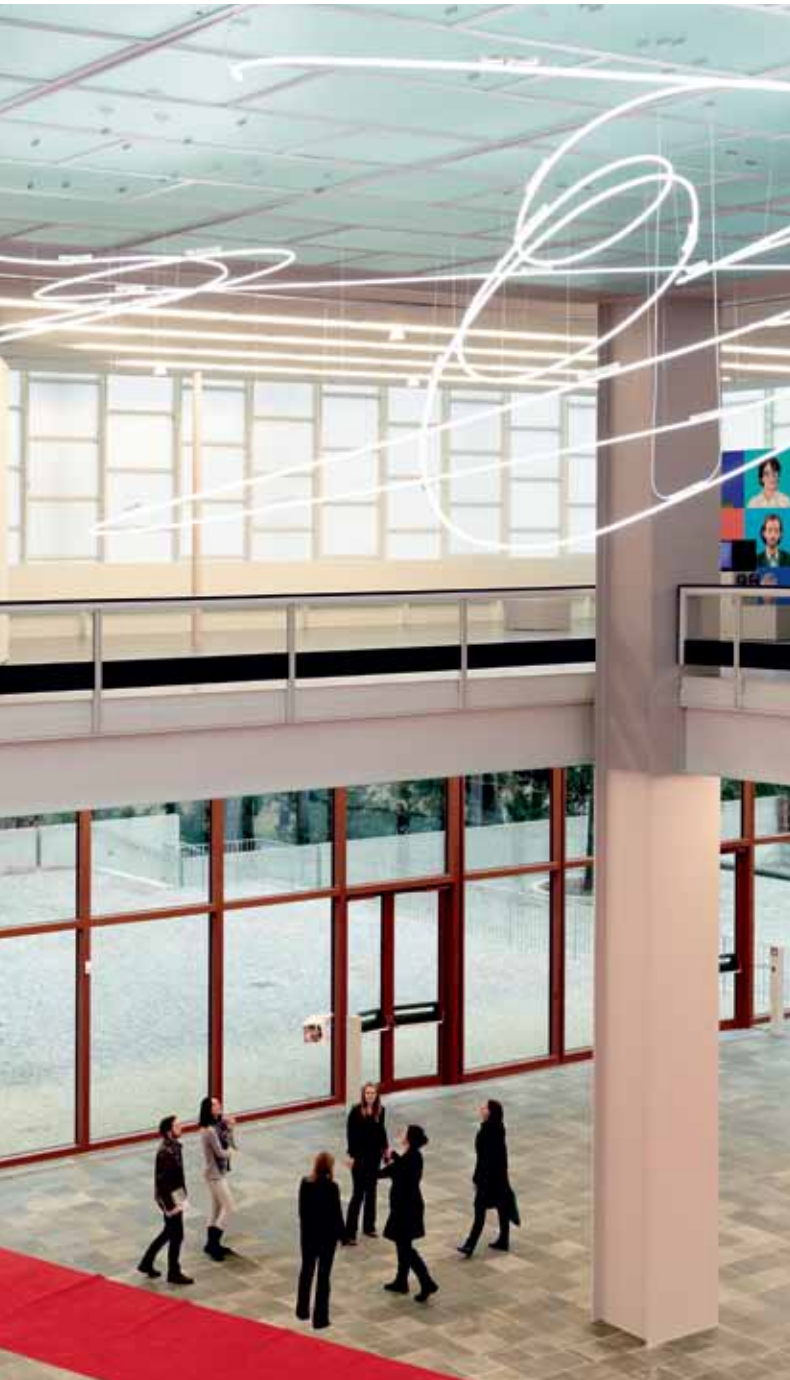
Kunstenthusiasten im 21er Haus